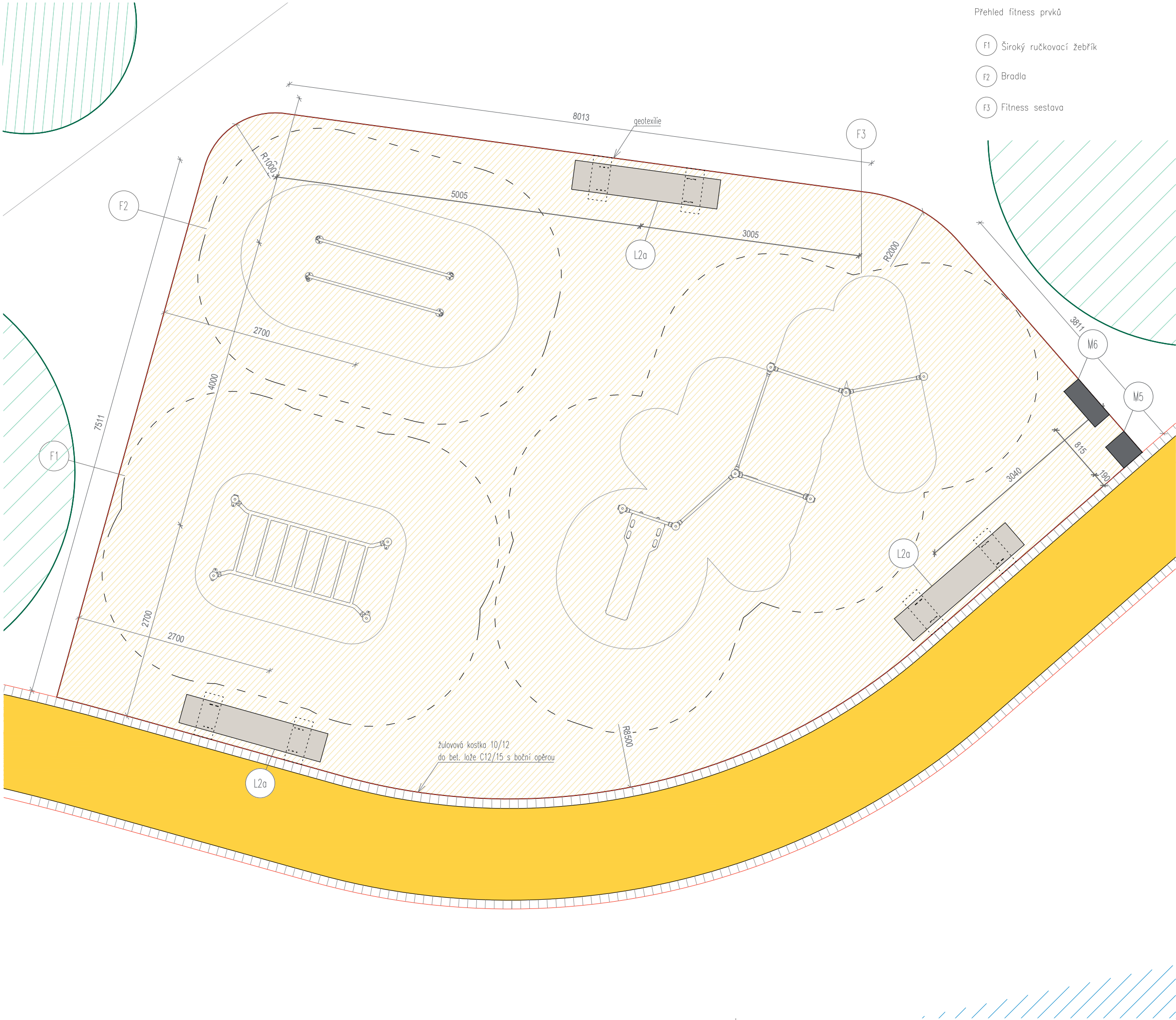
Přehled fitness prvků